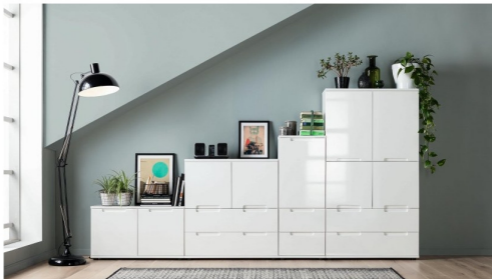
Selfboard Neili ist ein Kommoden-Programm, bei dem Einzelcontainer nach Belieben miteinander kombiniert werden können.