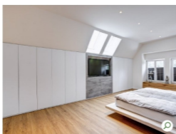
Viel Stauraum entstand bei diesem Projekt hinter geschlossenen Fronten und der Fernseher wurde auch geschickt eingebaut.

Für Schrägen direkt unter dem Dach sind diese Lösungen aber oft nur bedingt geeignet – vor allem wenn die Decke noch weit nach hinten abfällt. Regale bieten dann meist nicht die notwendige Tiefe und Flexibilität, um den Stauraum komplett auszunutzen. Die Folge: Der Platz dahinter bleibt ungenutzt – oder wird schnell vollgestellt.